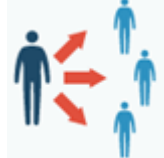
Estrecho Contacto con las personas